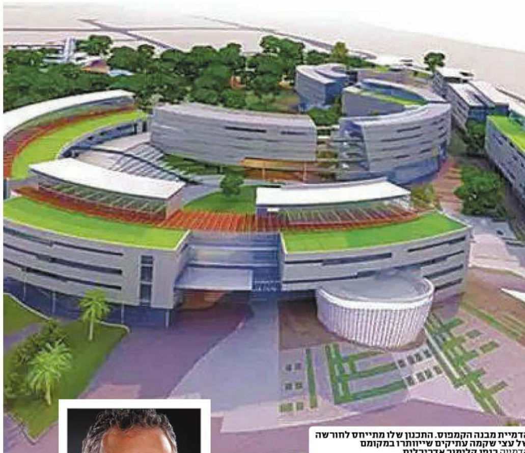
הדמיית מבנה הקמפוס. התכנון שלו מתייחס לחורשה של עצי שקמה עתיקים שייתורו במקומם הדמייה כנפו קלימור אדריכלים

במצב של חוסר אמון מוחלט, שממנו סובל ראש העיר היום, גם אם התושבים יתעוררו בבוקר ויראו את הקמפוס שנבנה בין לילה ניצב וקיים, עדיין לא יאמינו לו. שיפסקו כבר עם הספינים האלה ויתחילו לעבוד באמת. די לדבר על קאנטרי במקום לבנות אותו; מספיק לדבר על מרכז אקדמי. שיקימו אותו במקום לדבר עליו; די לקשקש על בנייה לזר גות צעירים בכל מערכת בחירות, ובפועל לא לבנות כלום; מספיק לדבר על ארנונה נמוכה, אבל להמשיך להעלות אותה כל שנה; נמאס לשמוע הבטחות על יציאת מקומות עבודה, כשרוב התושבים נוסעים לעבוד מחוץ לעיר; מספיק להבטיח בכל מערכת בחירות לשפר את פני הרבעים הוותיקים, כשבפועל המצב שם רק מחמיר; די לעבוד על הציבור; די למי כור סיסמאות; ככל שלא סופרים את התושב, כך משתמשים יותר ויותר בסיסמה 'התושב במרכז', כאילו רוצים ללעוג לנו. אחרי עשר שנים שבהן לא נעשה כלום בעיר לטובת התושב, אף אחד כבר לא קונה יותר את ההבטחות האלה. הציבור רוצה לתת הזדמנות להנהגה חדשה שבאה לפעול למענו, ולמענו בלבד."