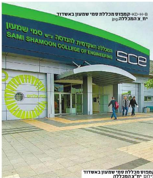
קמפוס מכללת סמי שמעון באשדוד

"לאחר שנים של תכנון ותחרות בין אדריכלים הנחת אבן פינה לקמפוס, גם אם העיתוי הוא חמישה חודשים לפני הבחירות, היא בשורה משמחת. אני מעריך שהבנייה תסתיים תוך מספר שנים, ויקח זמן נוסף להעתיק את מכללת סמי שמעון לקמפוס. אני מעריך שעוד חמש שנים הקמפוס יקרום עור וגידים, ואם המתחמים יהיו גדולים מספיק וייבנו מעונות לסטודנטים, אז ניתן יהיה לבשר על פריצת דרך משמעותית. בדיוק כמו בנושא בית החולים, ההתדיינות נמשכה שנים רבות, ולאחר הנחת אבן הפינה ההתקדמות הייתה מהירה יחסית כי מאחורי היוזמה עמד גורם פרטי ואיתן מבחינה כלכלית. חלום בית החולים קרם עור וגידים ומהווה פריצת דרך משמעותית, ולראש העיר ד"ר יחיאל לסרי מגיע חלק גדול מהקרדיט על כך. לגבי הקמפוס ימים יגידו, ומעניין מי יגזור את הסרט."