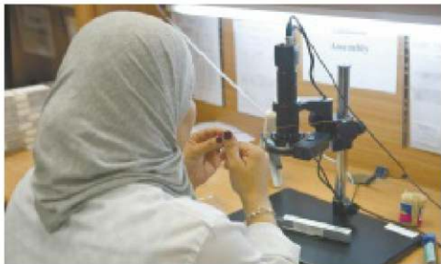
עובדת בחברת המכשור הרפואי אלפא אומנה, בנצרת